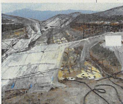
(草津市) ビニールハウス全壊