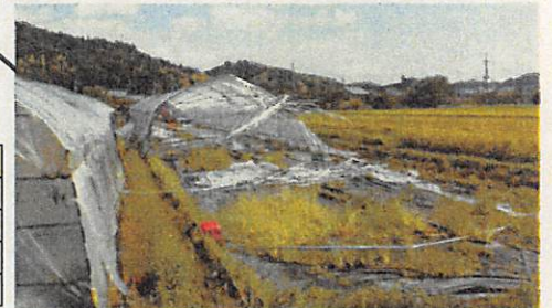
(湖南市) ビニールハウス半壊