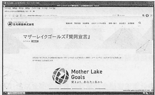
(日光精器株式会社)