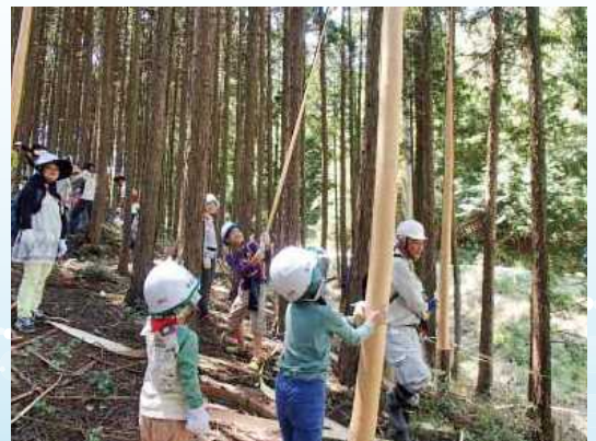
県民の協働による森林づくり