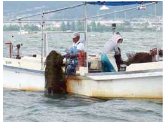
漁船と貝曳き漁具による水草の根こそぎ除去