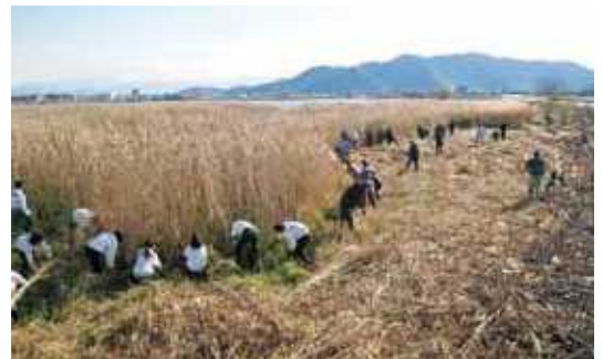
ヨシの刈取り作業