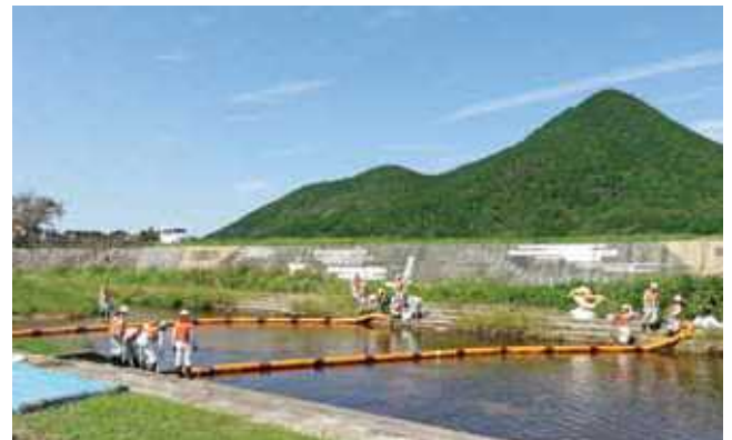
環境団体と行政による水質事故被害拡大防止訓練