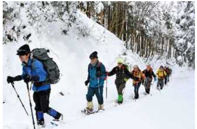
鈴鹿山系の「日本コバ」でのスノーシューハイイク