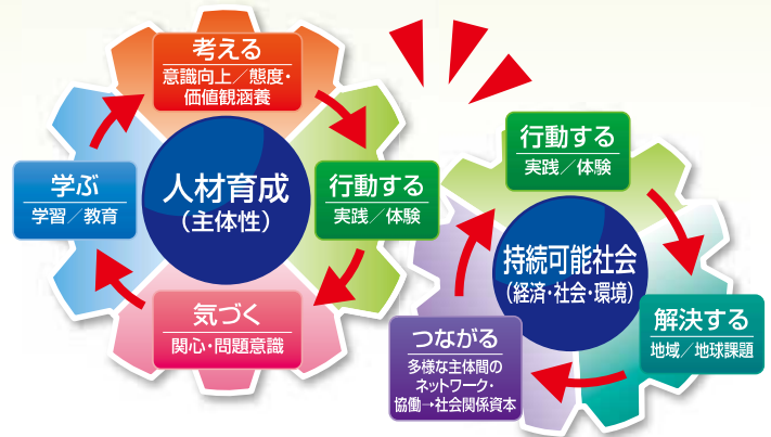
環境学習のギアモデル