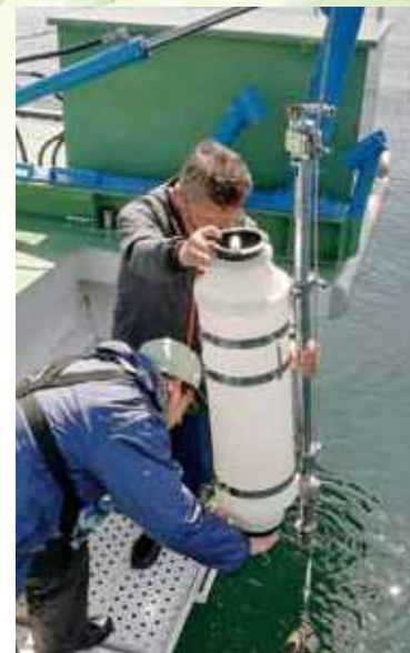
船上での水質調査