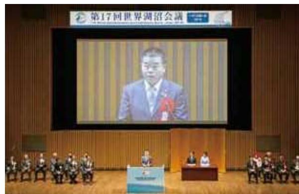
第17回世界湖沼会議（平成30年10月）