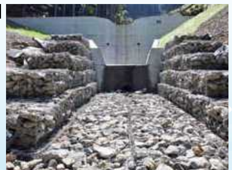
高島市朽木村井における復旧治山事業