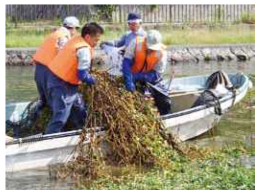
外来水生生物オオバナミズキンバイの除去作業