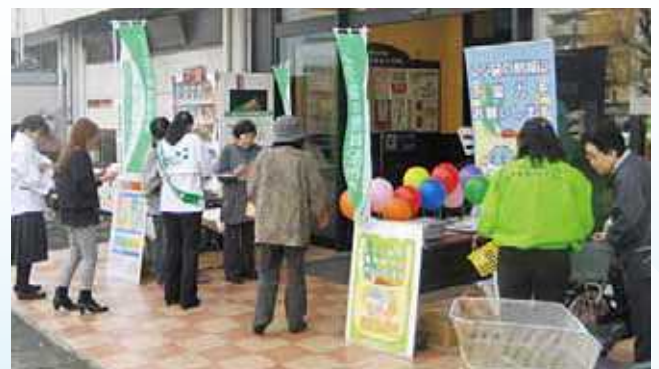
環境に優しい買い物キャンペーン