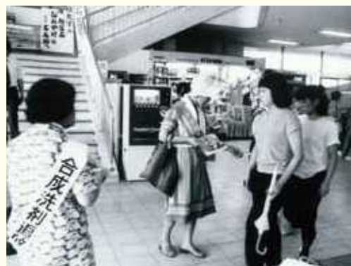
合成洗剤の追放を目指した石けん運動（1970年代）

このような取組に見られるような、多様な主体の協働、パートナーシップによって経済発展と環境保全を両立させた総合的な取組を、滋賀県では「琵琶湖モデル」と呼んでいます。