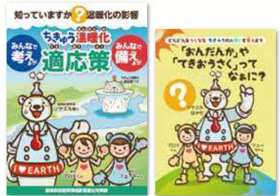
気候変動への適応策を普及するためのパンフレット