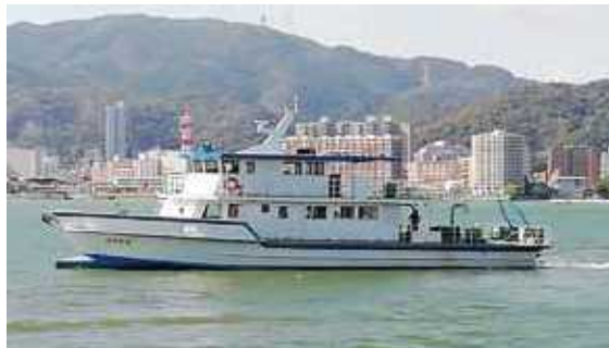
水質調査船「びわかせ」