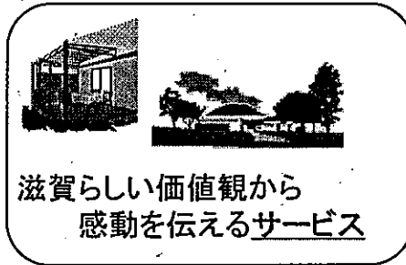
滋賀らしい価値観から感動を伝えるサービス