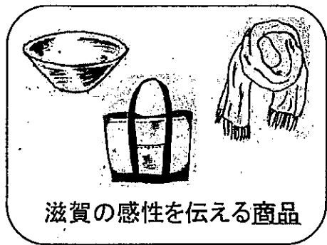
滋賀の感性を伝える商品

消費者の感性に働きかける新たな価値を創出するため、ブランドコンセプトの提案やこれに沿ったモノやサービスを県域で「選び」「魅せる」ことで、滋賀に共感するファン層の拡大を図るとともに、「ココクール マザーレイク・セレクション」の選定に向けた事業者の商品開発やサービス向上の努力を通じて、広く本県の商業力の向上につなげる。