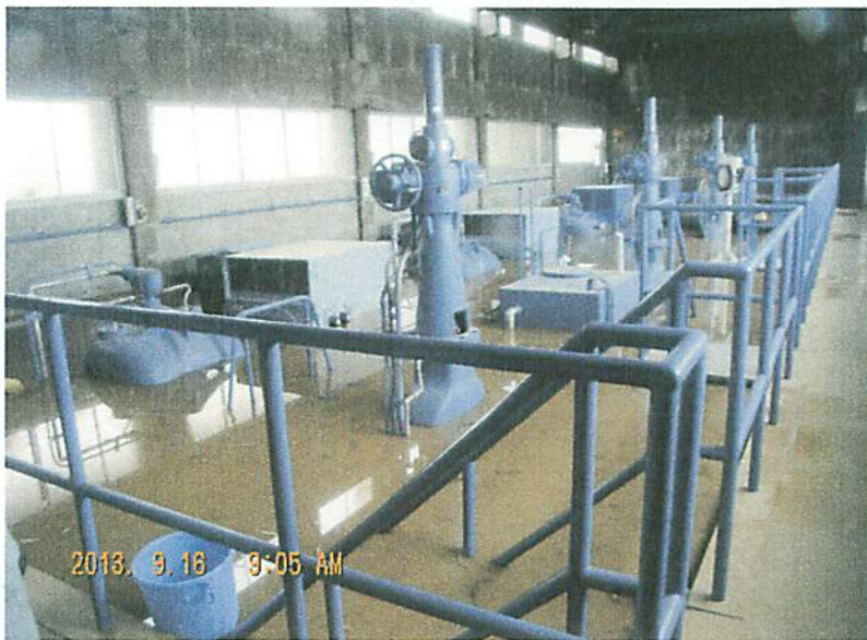
鴨川揚水機場 第一段ポンプ場 【浸水状況】