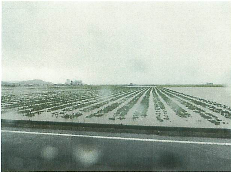
大中地域 キャベツほ場 【浸水状況】