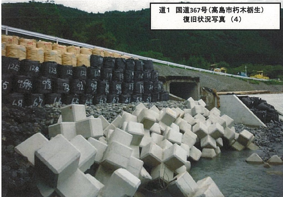
道1 国道367号(高島市朽木栃生) 復旧状況写真 (4)