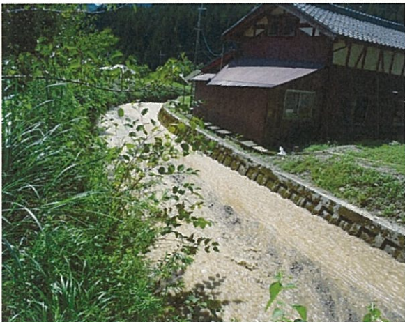
■砂10 こも谷(高島市高島富坂) 土砂流出・堆積による河道閉そく