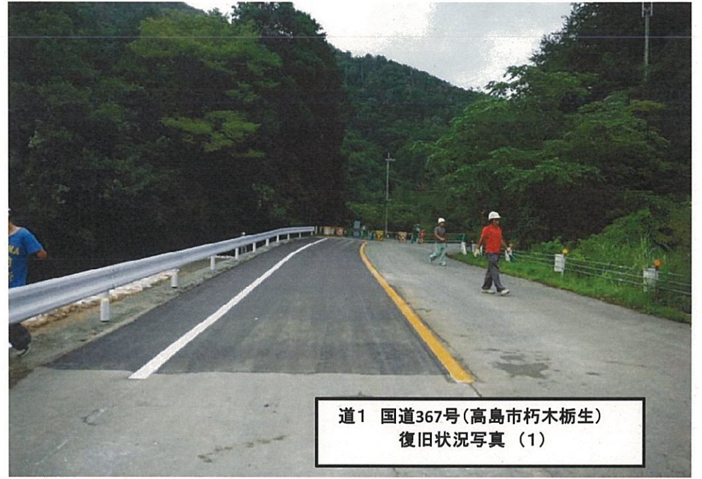
道1 国道367号(高島市朽木栃生) 復旧状況写真 (1)