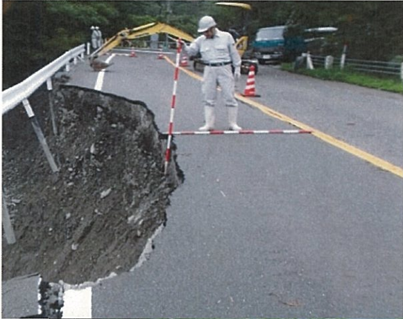
■道1 国道367号(高島市朽木栃生) 護岸崩壊、路肩欠損