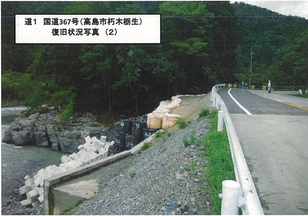
道1 国道367号(高島市朽木栃生) 復旧状況写真 (2)