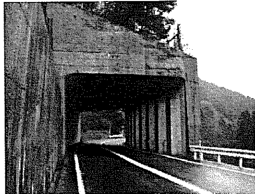
シェッド（国道477号_甲賀市土山町）