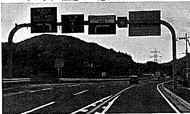
門型標識（国道477号_竜王町）