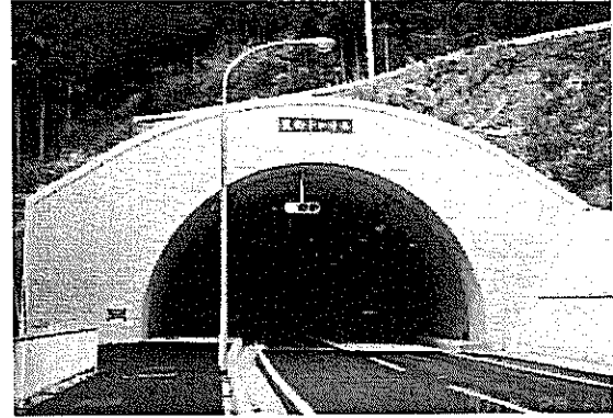
トンネル（裏白トンネル_甲賀市信楽町）