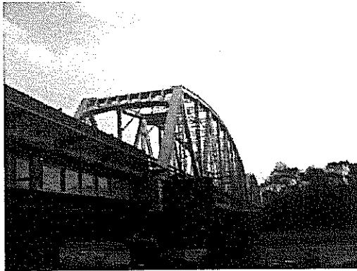
橋梁（安曇川大橋_高島市）