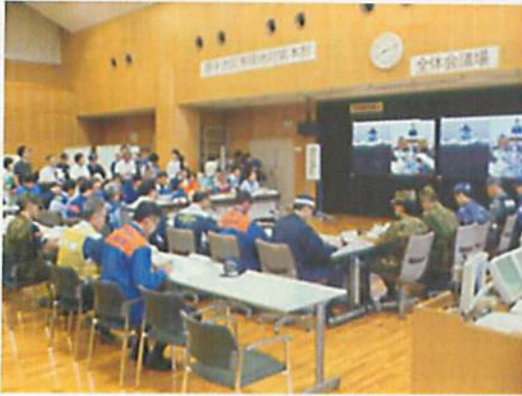
[ (国)原子力災害合同対策協議会 ]