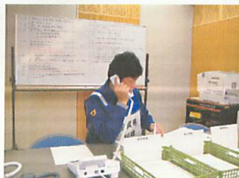
[ 美浜 OFC 滋賀県ブースでの活動 ]