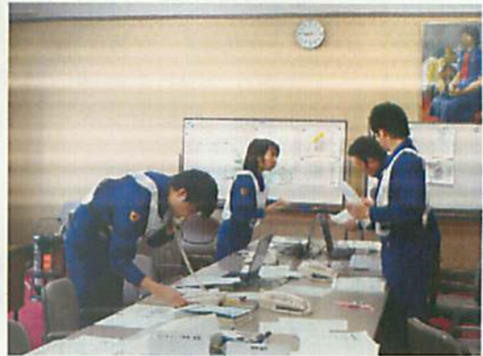
[ 緊急時モニタリング本部 ]