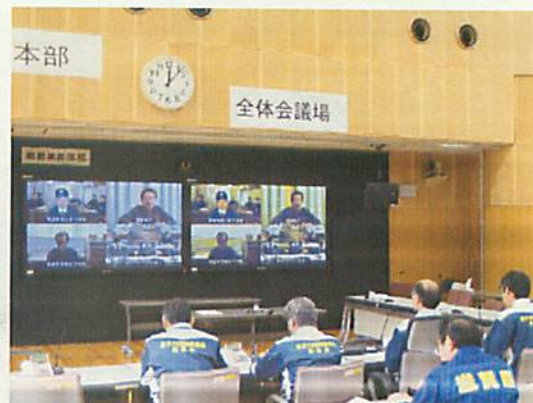
[ テレビ会議システム運用(美浜 OFC) ]