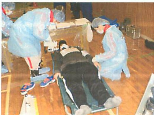
[ 負傷者への対応(今津西小学校) ]