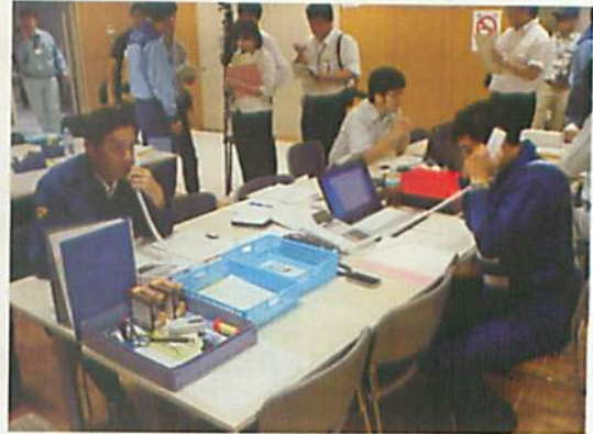
[ 高浜 OFC 滋賀県ブースでの活動 ]