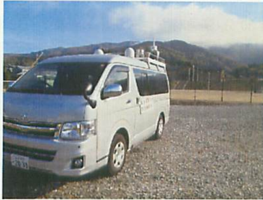
[ モニタリング車による測定 ]