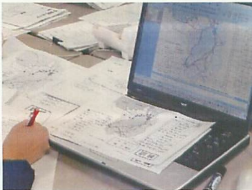
[ 報道機関向け提供資料(モニタリング関係)の作成 ]