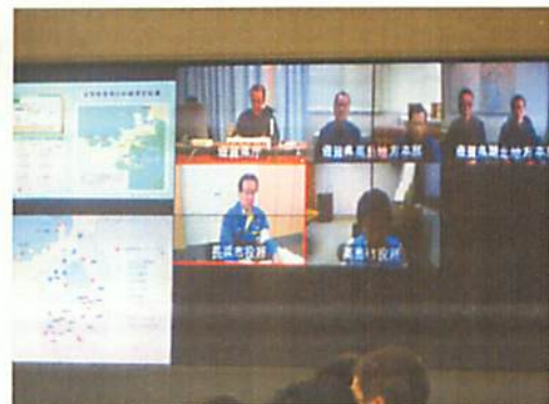
[ テレビ会議 ]