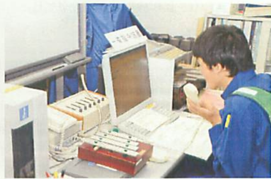
[ 館内放送による随時アナウンス ]