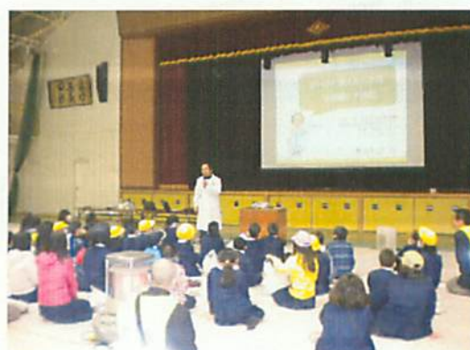
[ 児童向け講習会(南郷里小学校) ]