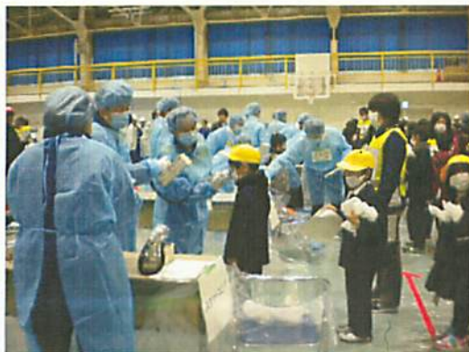
[ スクリーニング(南郷里小学校) ]