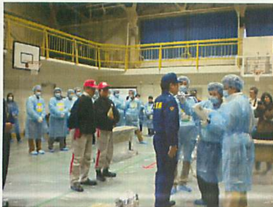
[ 知事によるスクリーニング体験(南郷里小学校) ]