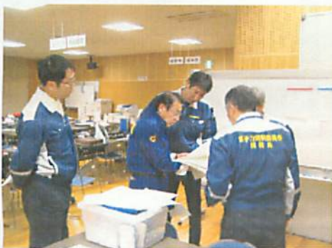
[ (国)原子力防災専門官と調整 ]