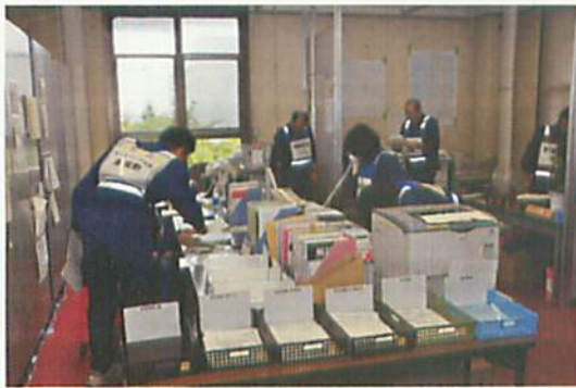
[ 災害対策本部事務局 ]