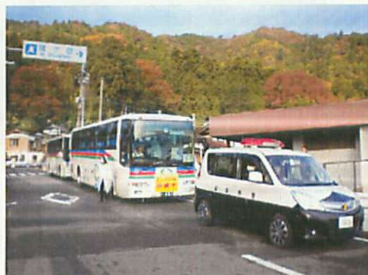
[ バスによる住民移動(長浜市会場) ]