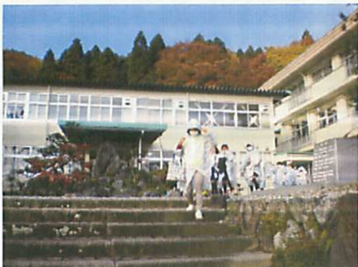
[ 住民避難(伊香具小学校) ]