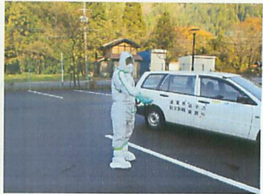
[ サーベイメータによる測定 ]