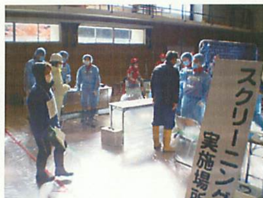
[ スクリーニング(今津西小学校) ]