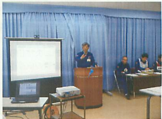
[ 広報班長による記者説明 ]