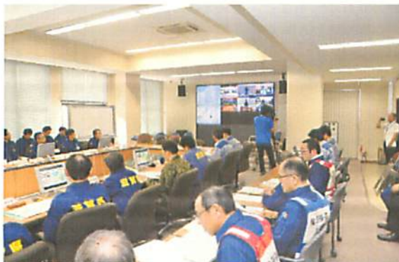
[ 災害対策本部本部員会議 ]