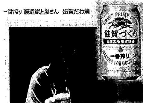
キリン一番搾り滋賀づくり H27.5