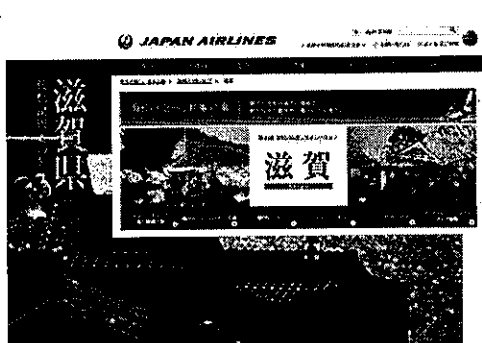
JAL JAPAN PROJECT H27.3