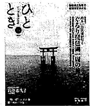
「ひととき」(東海道・山陽新幹線グリーン車搭載誌) H27.6