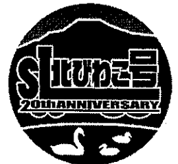
記念シンボルマーク