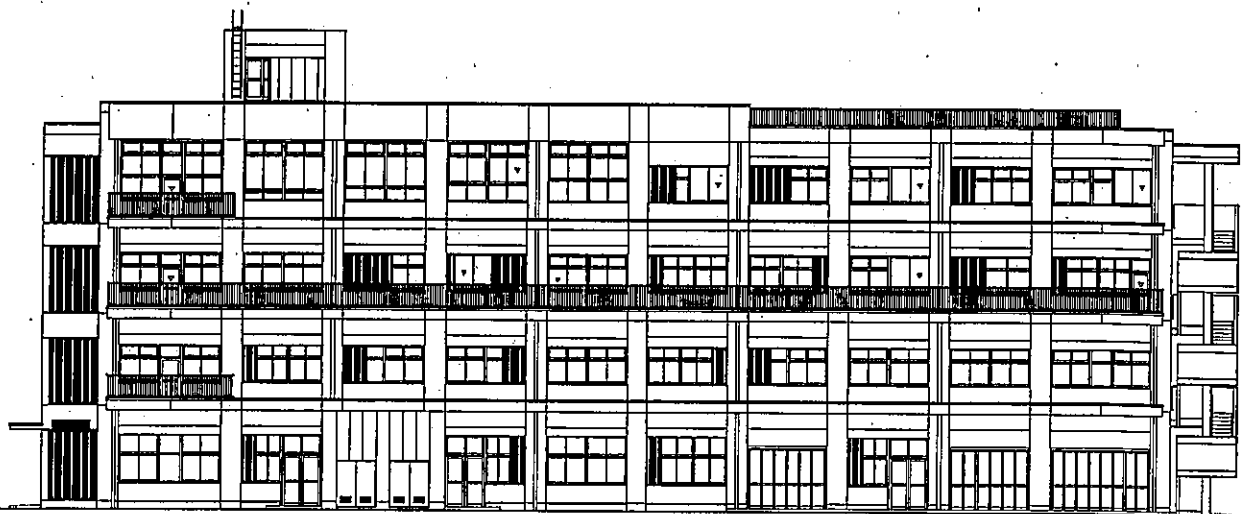
工業・商業・福祉実習棟