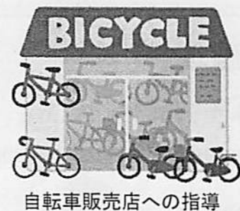
自転車販売店への指導