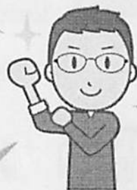
滋賀県自転車 安全利用指導員