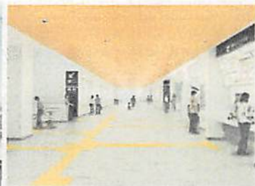
自由通路内観イメージ