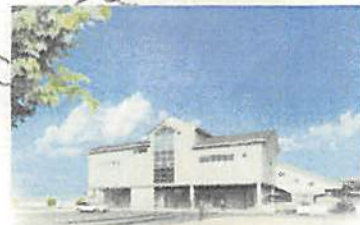
JR安土駅 完成予定図 ※H29年度完成予定