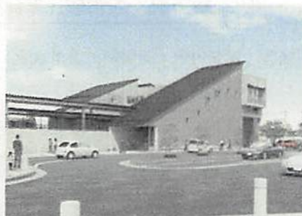
駅西口側外観イメージ