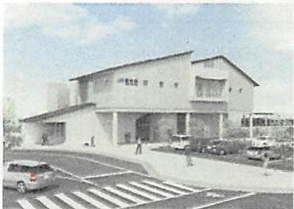
駅東口完成イメージ図