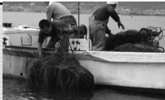
水草刈取(根こそぎ除去)