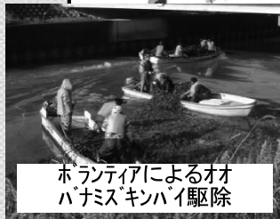
ボランティアによるオオバナミズキンバイ駆除