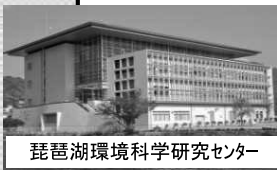
琵琶湖環境科学研究センター