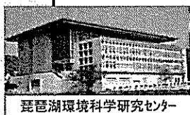
琵琶湖環境科学センター