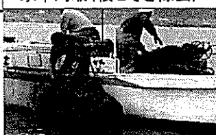
水草刈取(根こそぎ除去)