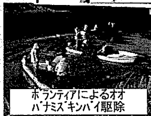
ボランティアによるオオバナミズキンバイ駆除