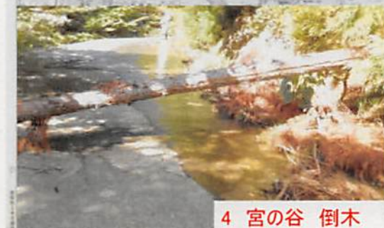
4 宮の谷 倒木