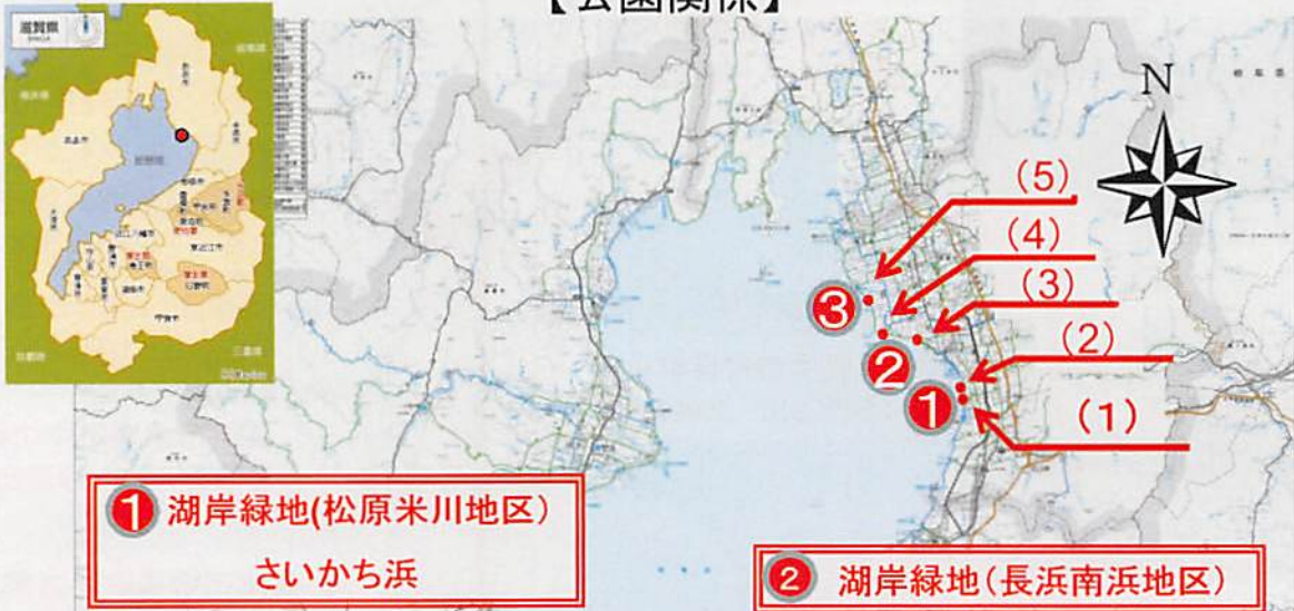
① 湖岸緑地(松原米川地区) さいかち浜