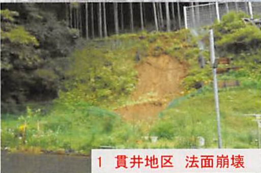
1 貫井地区 法面崩壊