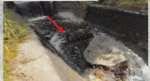
3 岩谷川 流路工破損