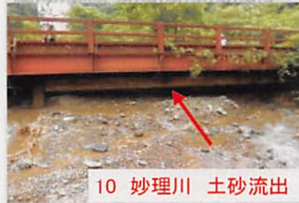
10 妙理川 土砂流出