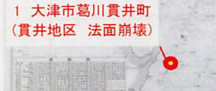
1 大津市葛川貫井町 (貫井地区 法面崩壊)