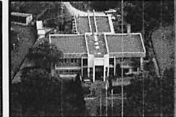
参3 野外活動センター