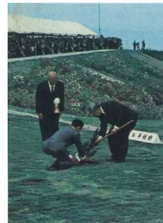
天皇陛下お手植え (ヒノキ)