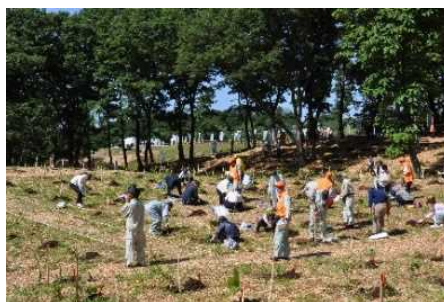
植樹会場 (第68回全国植樹祭〔富山県〕)