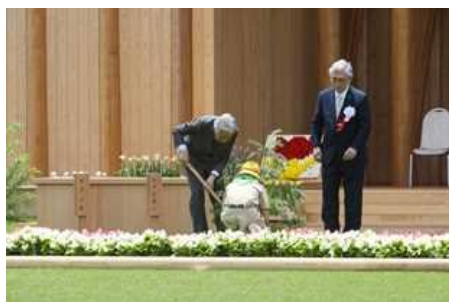
天皇陛下お手植え