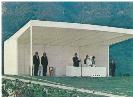
天皇陛下のおことば