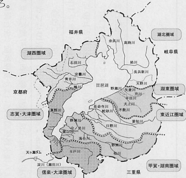
図 河川整備計画の各圏域