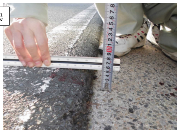
舗装面と街渠との段差約 5 c m