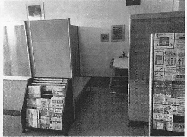
【相談窓口、相談員室の様子】