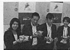
▲ びわ湖の日記念商品 記者発表(6月11日)