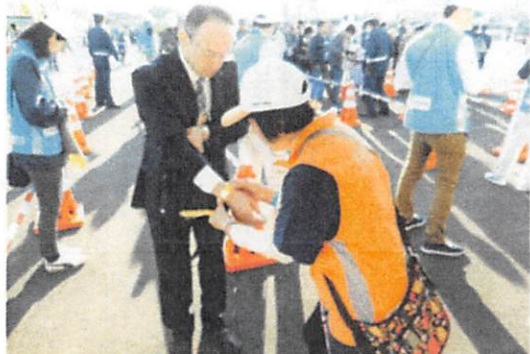
ID チェック(開閉会式)