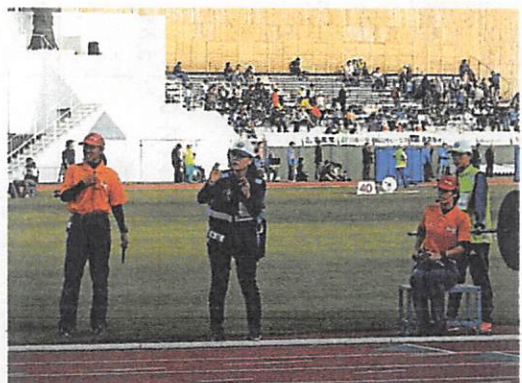
競技会場(スタート地点)の手話