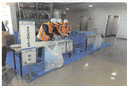
ドリンクサービス(競技会場)