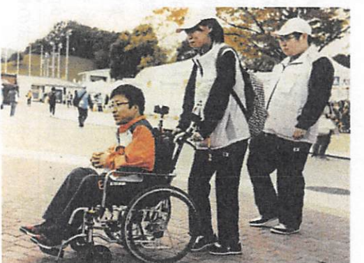
車いす使用選手のサポート