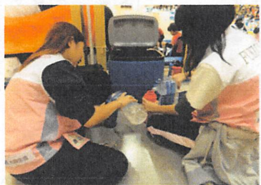
選手用のドリンクづくり