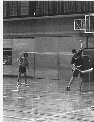
滋賀短期大付属高校バドミントン部