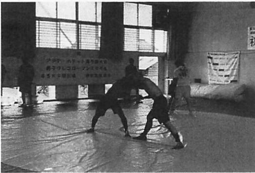
日野高校レスリング部