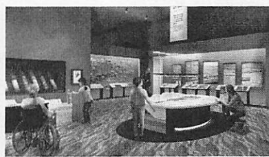
〈地層の標本・体験型展示〉