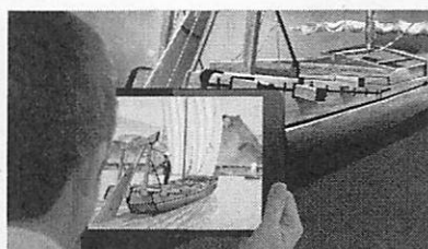
〈丸子船にAR技術を用いた展示〉