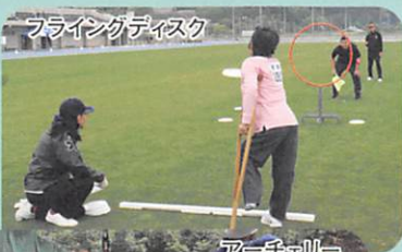
フライングディスク

県大会の個人競技の 参加対象は県内に在住の 身体障害者・知的障害者で 12歳以上です。