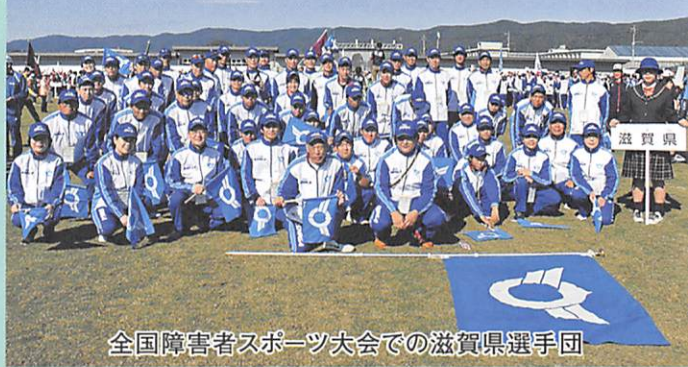
全国障害者スポーツ大会での滋賀県選手団

〒520-0807 滋賀県大津市松本1-2-20 農業教育情報センター 5階 TEL 077-522-6000 FAX 077-521-8118 E-mail info@shigassk.net URL http://www.shigassk.net