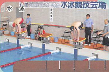
水泳 水泳競技会場