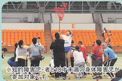
※知的障害児・者と18才未満の身体障害児が 参加対象です。