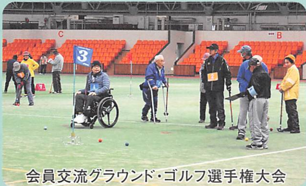
会員交流グラウンド・ゴルフ選手権大会

会員交流大会 ※参加対象は、協会会員のみ。参加希望の方は、会員登録をお願いします。(大会参加費無料)