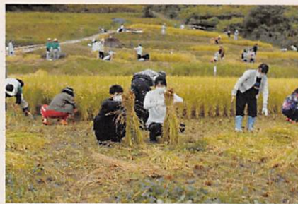
◆指定棚田に指定された上仰木地区における棚田オーナーの稲刈り状況