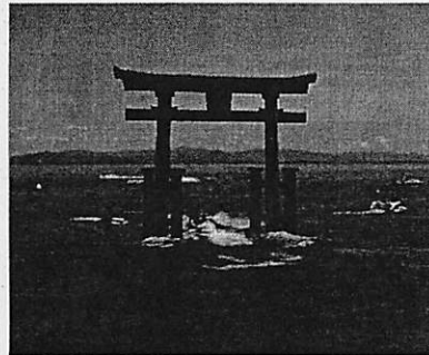
白鬚神社湖中大島居(高島市)