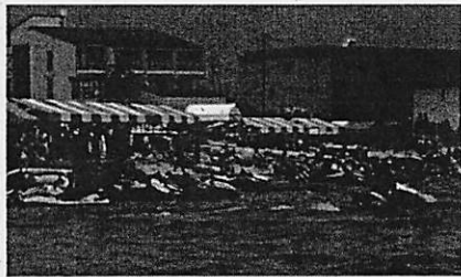
近江舞子・北比良(大津市)