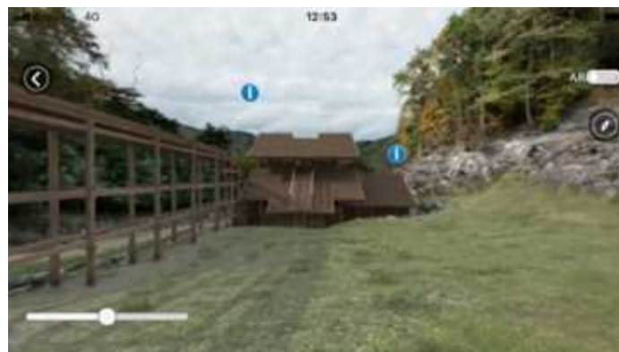
釜石市橋野鉄鉾山ガイドアプリ ARで高炉の構造を再現し、 往時の姿を体験