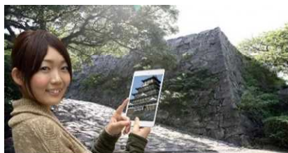
VR 福岡城 CGによる福岡城の復元