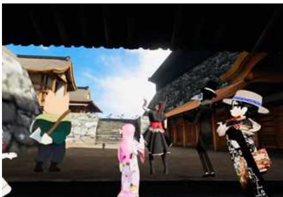
安土城ヴァーチャルツアー アバターとしてヴァーチャル (CG) の安土城空間に参加 (近江八幡市・凸版印刷株式会社)