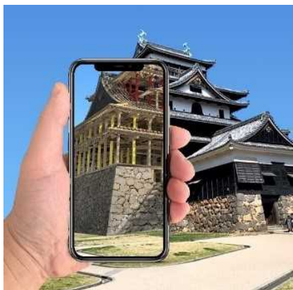
AR 松江城 国宝松江城天守外観と内部 骨組みCGの結合