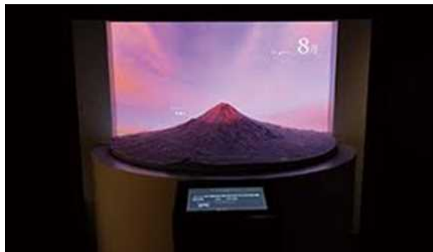
富士山プロジェクションマッピング 富士山の模型にCGを合成