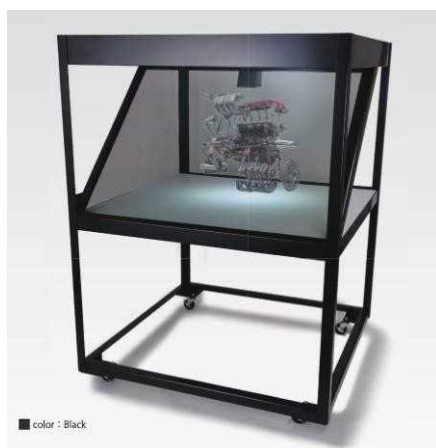
ホログラムディスプレイ ホログラムによる資料展示