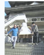
地域文化財の保存支援