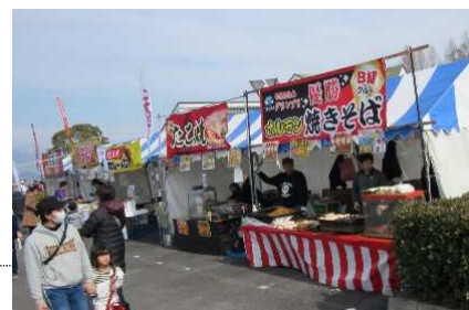
びわ湖レイクサイドマラソンでの烏丸半島おもてなし