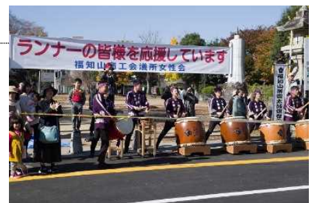
他大会での沿道応援