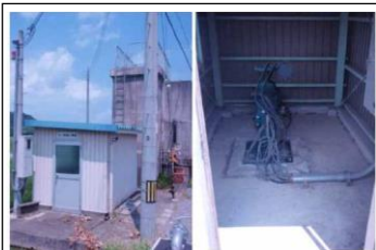
(既設地下水揚水機)