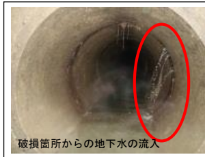
破損箇所からの地下水の流入