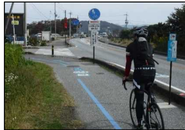
自転車歩行者専用道路