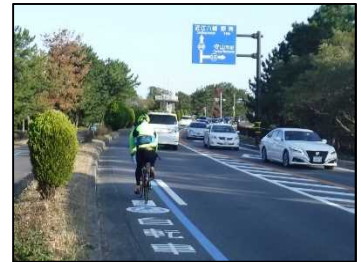
自転車専用通行帯