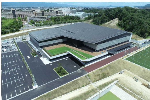
事業地南側から撮影 (令和 4 年 7 月)