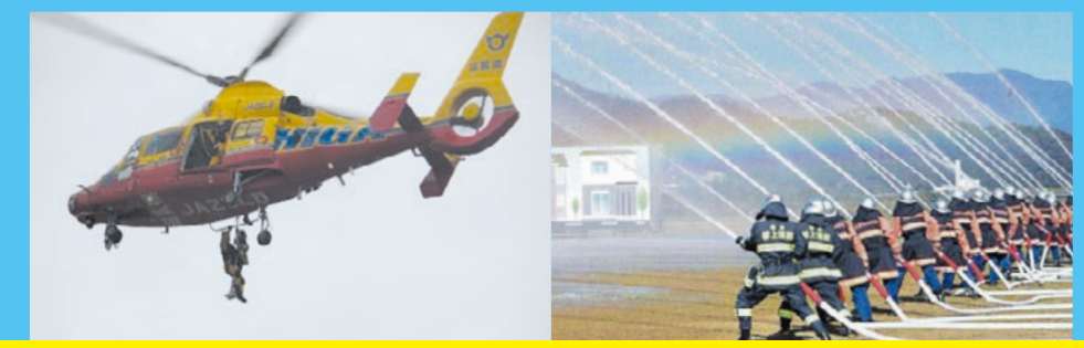
近畿の消防特殊車両やヘリが多数参加します!

会場付近では、多くの訓練車両が通行します。また、ヘリコプター等による騒音も発生し、近隣の皆様にはご不便・ご迷惑をおかけしますが、訓練実施へのご理解・ご協力をお願いいたします。