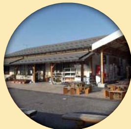
道の駅せせらぎの里こうら