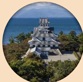
長浜城歴史博物館