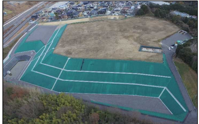
現在（令和 5 年 1 月）の旧処分場