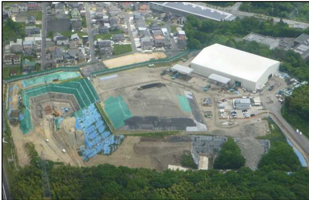
工事中（平成 28 年 5 月）の旧処分場