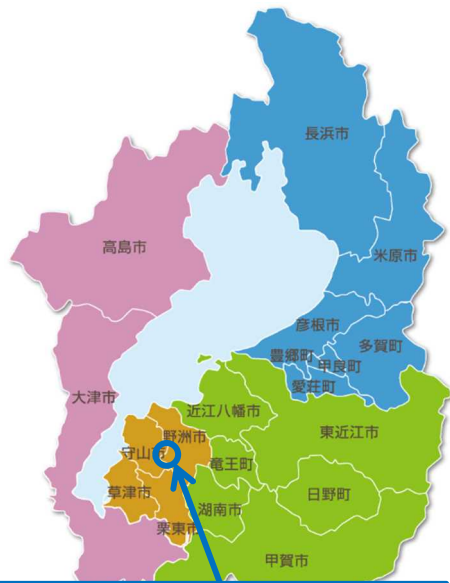
滋賀県立 近江富士花緑公園

設置目的 森や花、緑に親んでもらうために設置 平成4年開園 面積52.2ha 設置者 滋賀県（琵琶湖環境部森林政策課） 指定管理者 近江富士花緑公園ゆうゆうパートナーズ（西武造園(株) 本社東京都） 所在地 滋賀県野洲市三上519（林業普及センター隣、希望が丘文化公園隣接）