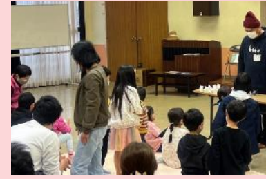
NPOによる居場所づくり

健康医療福祉部 健康寿命推進課 子ども・青少年局 教育委員会事務局 幼小中教育課