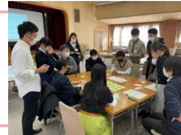
しが若者ミーティング