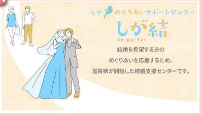
結婚支援センター「しが結」