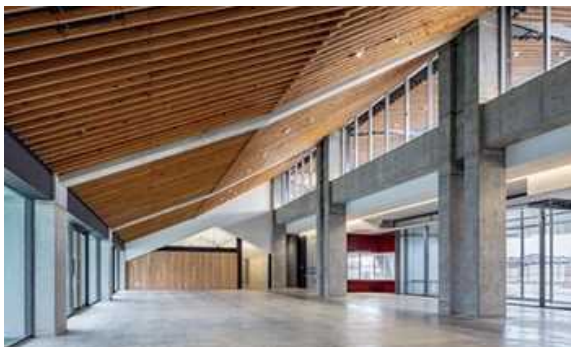
平和堂 HATO スタジアム (第1種陸上競技場)