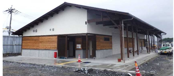
金亀公園(第3種陸上競技場)管理棟