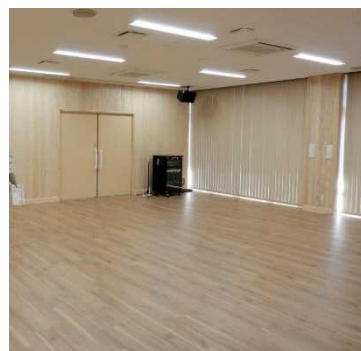
水口社会福祉センター