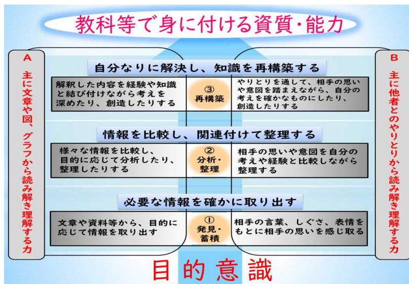
24 図2 「読み解く力」のイメージ（令和2年度改訂版）

17 「読み解く力」には、文章や情報を正確に読み解き理解する力と、相手の言葉やし 18 ぐさ、表情から、相手の意図や思いを読み解き理解する力の2つの側面があるものと 19 捉えている。そして、その両面から「必要な情報を確かに取り出す」、「情報を比較し、 20 関連付けて（自分と結び付けて）整理する」、「自分なりに解決し、知識を再構築する」 21 というプロセスを、どの発達段階においても意識して「読み解く力」を育成するとと 22 もに、その過程においては、自分のまとめたことや考えたことを表現する力の育成を 23 同時に進めていくことが大切であると考えている。