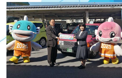
企業・団体による啓発協力