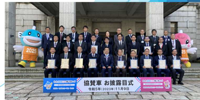
協賛車両 合同お披露目式