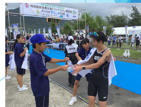
中高生による競技運営補助