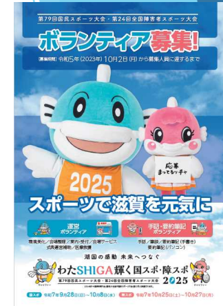
ボランティア募集