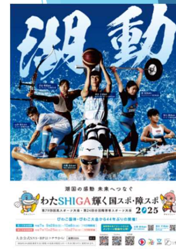
大会啓発ポスターの制作