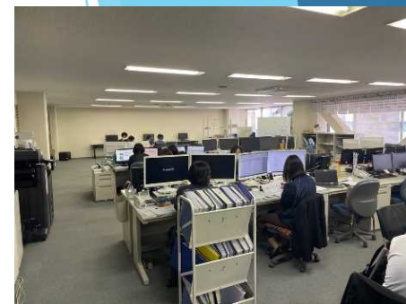
宿泊輸送センター（先催県）