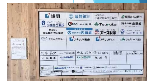
寄附者銘板の設置 (平和堂HATOスタジアム)