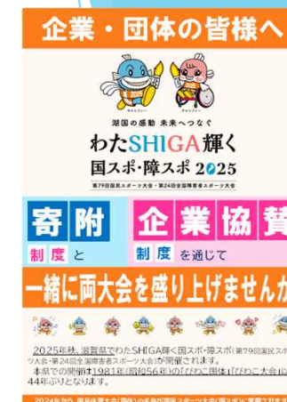
寄附・企業協賛の依頼活動