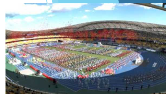
滋賀らしい開・閉会式に向けて