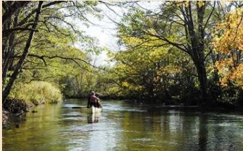
自然を満喫できる楽しみ方の提供

望ましい自然体験アクティビティの開発・提供の促進、利用者の受入れ体制整備、上質な自然体験の場の確保、適正利用のためのルールの策定等