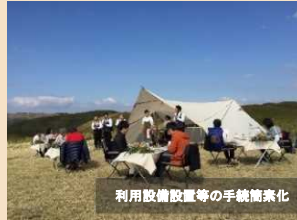
利用設備設置等の手続簡素化