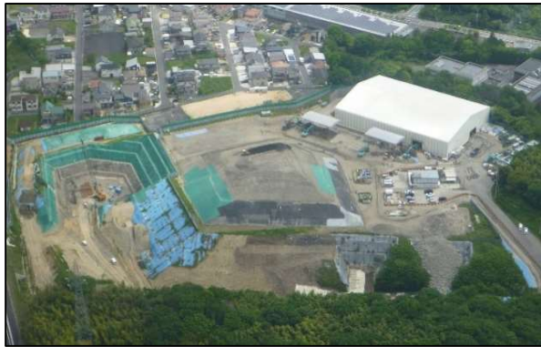
工事中(平成28年5月)の旧処分場