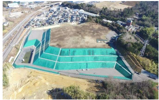
現在(令和6年1月)の旧処分場