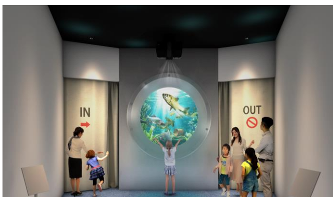
滋賀県ブースのイメージ (プレショー)