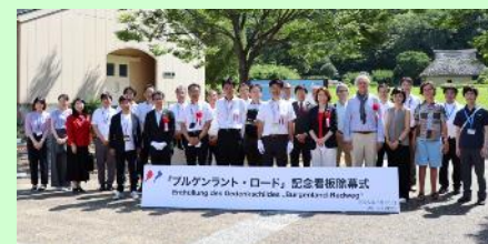
ブルゲンラント・ロード