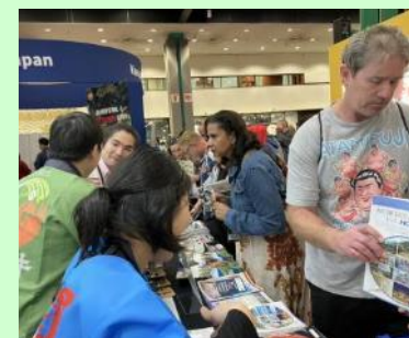
令和6年 現地旅行博