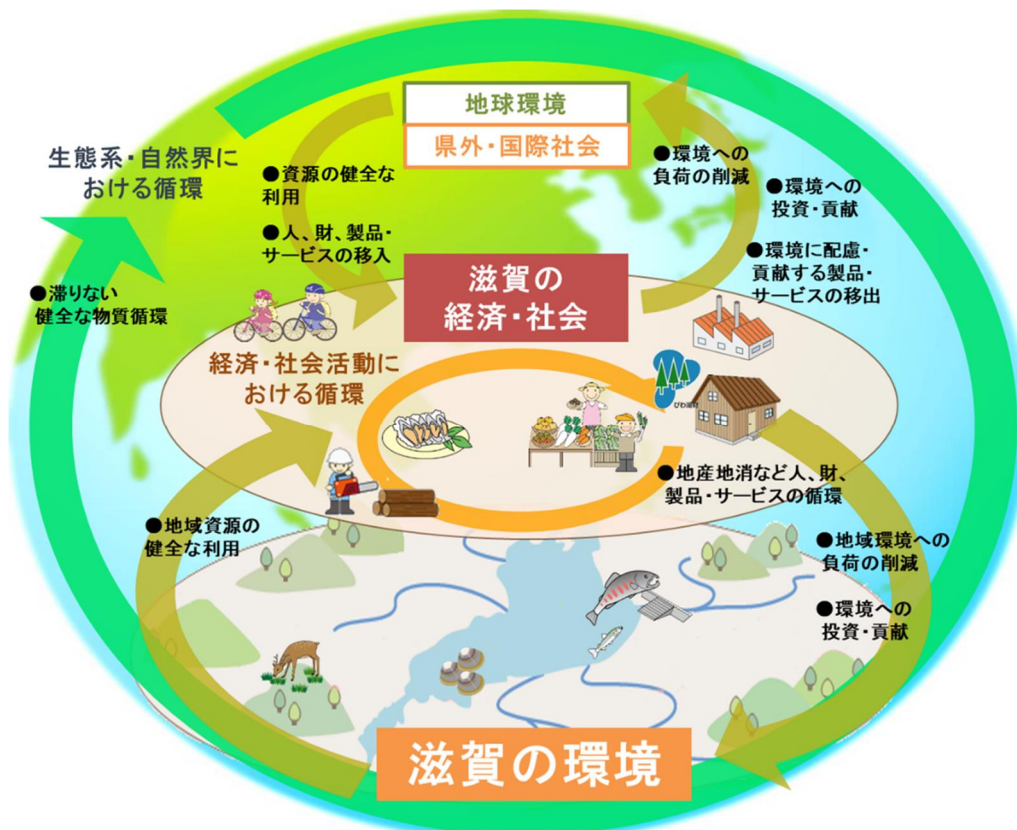
環境と経済・社会活動をつなぐ健全な循環

この「健全な循環」とは、里山や琵琶湖の周辺などにおいて成り立ってきた、森林資源や在来魚介類などの地域資源を地域社会の経済システムの中で健全に利用する自立・分散型の循環を基礎として、地域資源を介して異なる地域が相互に支え合う関係をいいます。そこでは、人、財、製品、サービスなどが地域内で循環しているだけでなく、地域間で行き交っています。