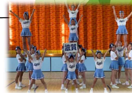
滋賀学園高校 チアリーディング部