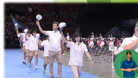
（参考）R7.7.24に開催された開会式の様子