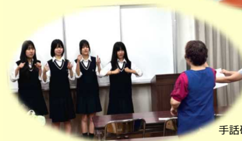
手話研修会の様子