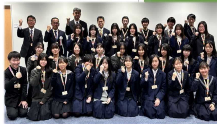
(令和6年12月21日 委員委嘱式の集合写真)

生徒が、スポーツを、「する」「みる」だけでなく、「ささえる」立場から、 主体的 に準備・運営に携わり、様々な人と交流し、 感動 や 達成感 を得られる大会を目指す 現在 41名 の高校生活動推進委員が活動中