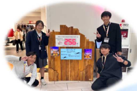
カウンタダウンボード設置 (草津イオンモール)