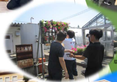
草花装飾試験栽培