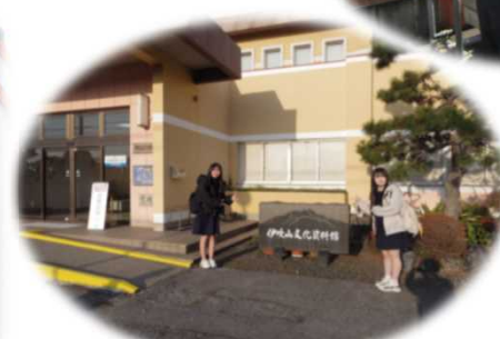
おもてなしマップ取材活動