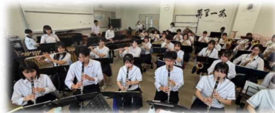
膳所高校吹奏楽班