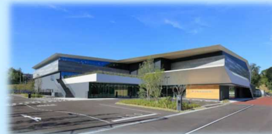
ダイハツアリーナ