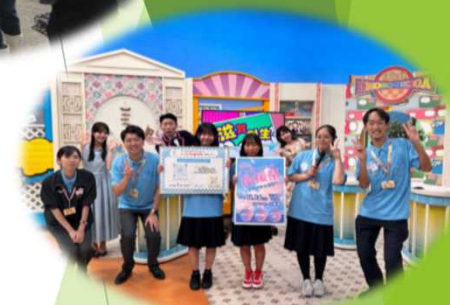
BBC番組「金曜オモロしが」出演