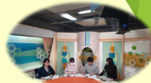
アナウンサー研修会の様子