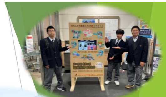
カウンタダウンボード設置 (アル・プラザ草津)