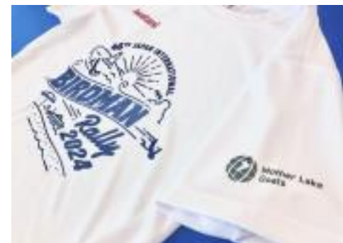
読賣テレビ放送(株) 鳥人間コンテストスタッフTシャツ