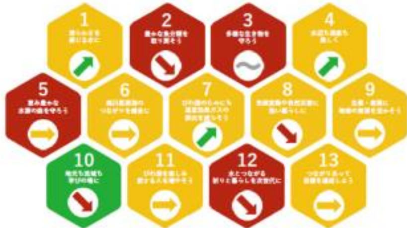
学術フォーラムによる各ゴールの評価(2025年) 六角形の色は状態、矢印は傾向を表す