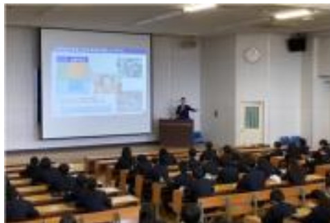
光泉カトリック中学校での授業